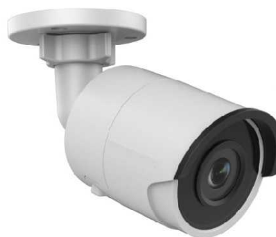
Opcjonalny adapter montażowy (puszka) AD-12